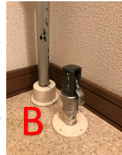
①室内の止水栓を水抜き側にする。 A=水抜き側へ最後まで回す B=レバーを水抜き側にする