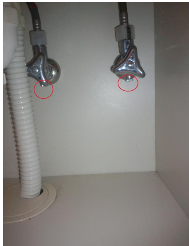
⑦洗面台下の赤丸印のネジを2ヶ所緩める。 口が広いペットボトル等を用意するとやりやすいです。